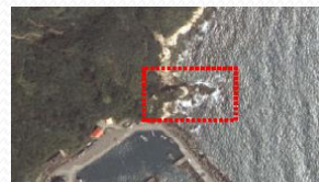
5. 水尾漁港左側一線天景點礁石區