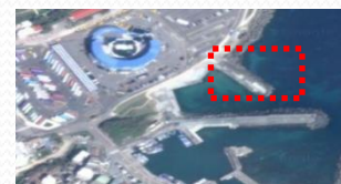
7. 海洋世界後方海王星碼頭邊堤