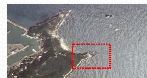
6. 獅頭山公園中正亭下方步道岬角礁石區