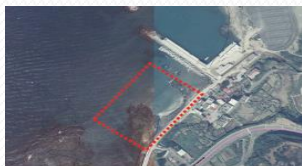
3. 富基漁港港區入口消波塊旁淺灘區