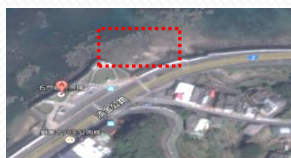
2. 富貴角婚紗廣場右側下方海灘區