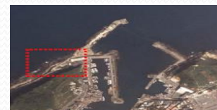
9. 野柳地質公園第三區