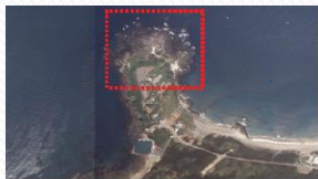
1. 麟山鼻岬角石滬區一帶釣場