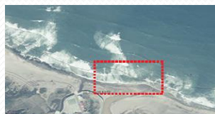
4. 富貴角老梅溪口出海口處