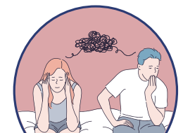
發生無防護措施行為 (未用保險套)