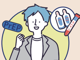
每3-6個月定期接受愛滋篩檢 使用PrEP