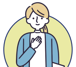
接受諮詢及戒癮服務