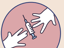
共用針具或稀釋液