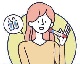
每3-6個月定期接受 愛滋篩檢