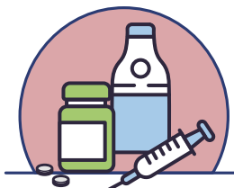
安非他命等藥物濫用