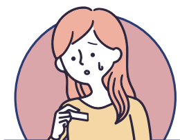
感染愛滋、梅毒等 性傳染病