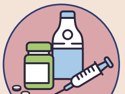
海洛因等藥物濫用