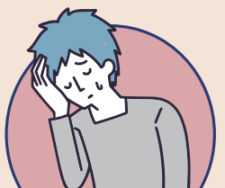
感染愛滋等血液傳染病