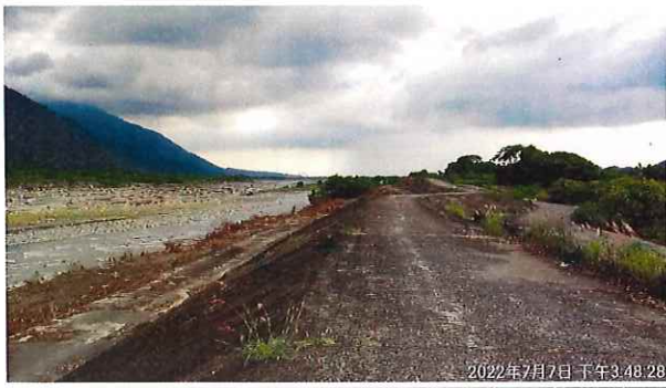
自行車道環境改善里程約 2K+450