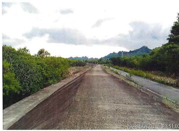
自行車道環境改善里程約 3K+250