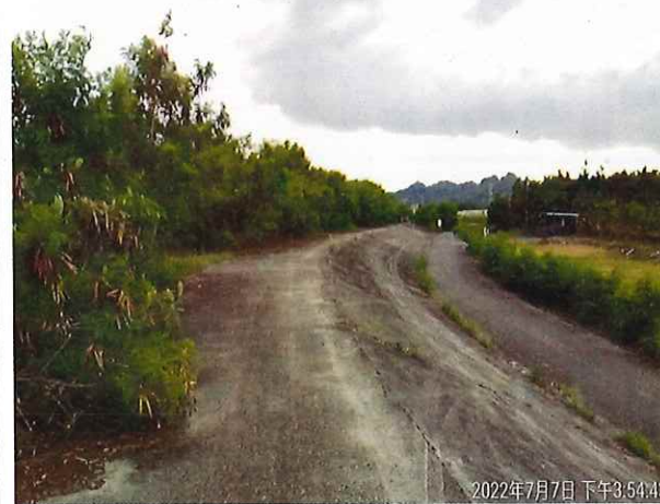
自行車道環境改善里程約 3K+750