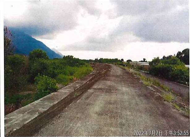
自行車道環境改善里程約 3K+450