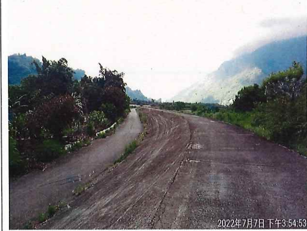
自行車道環境改善里程約 3K+750