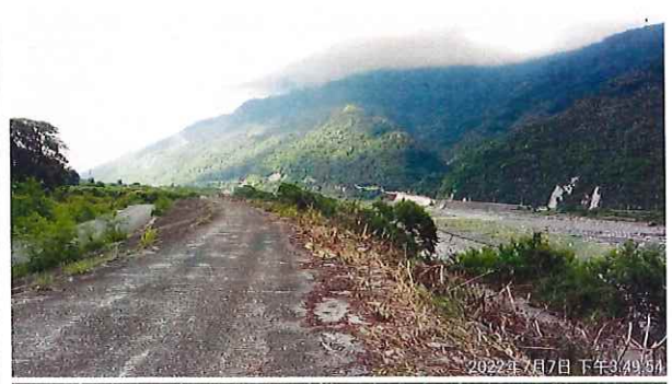
自行車道環境改善里程約 2K+950