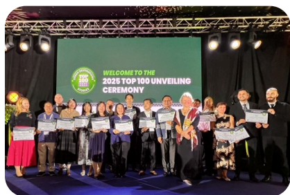
「2025全球綠色目的地百大故事獎」29日在法國奧克西塔尼頒發，台灣共9大故事參賽獲