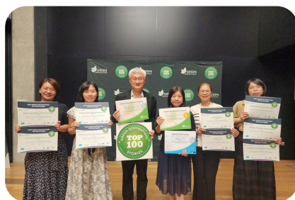
2025全球綠色目的地年會頒獎典禮