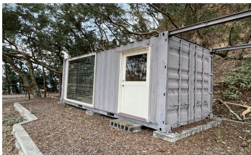
本處設施-貨櫃屋(臨時服務空間)