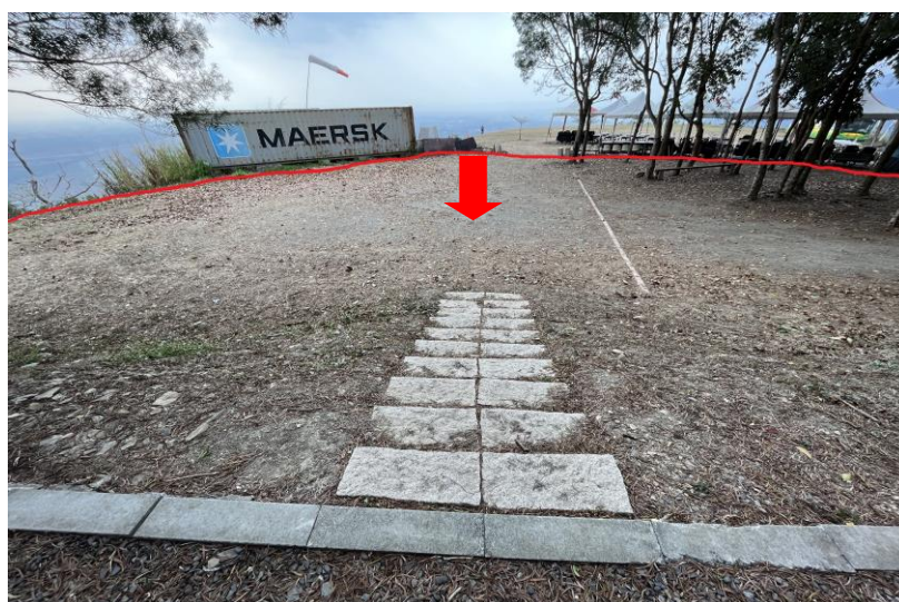
貨櫃屋前使用範圍(紅線內)