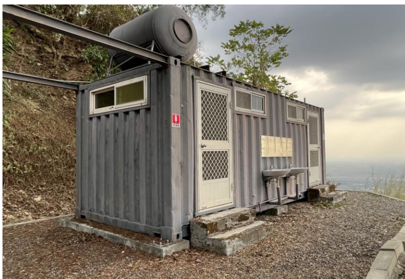
本處設施-貨櫃屋(臨時男、女廁所)