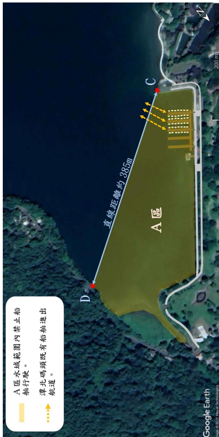
交通部觀光署花東縱谷國家風景區管理處【鯉魚潭船隻禁止行駛水域示意圖】