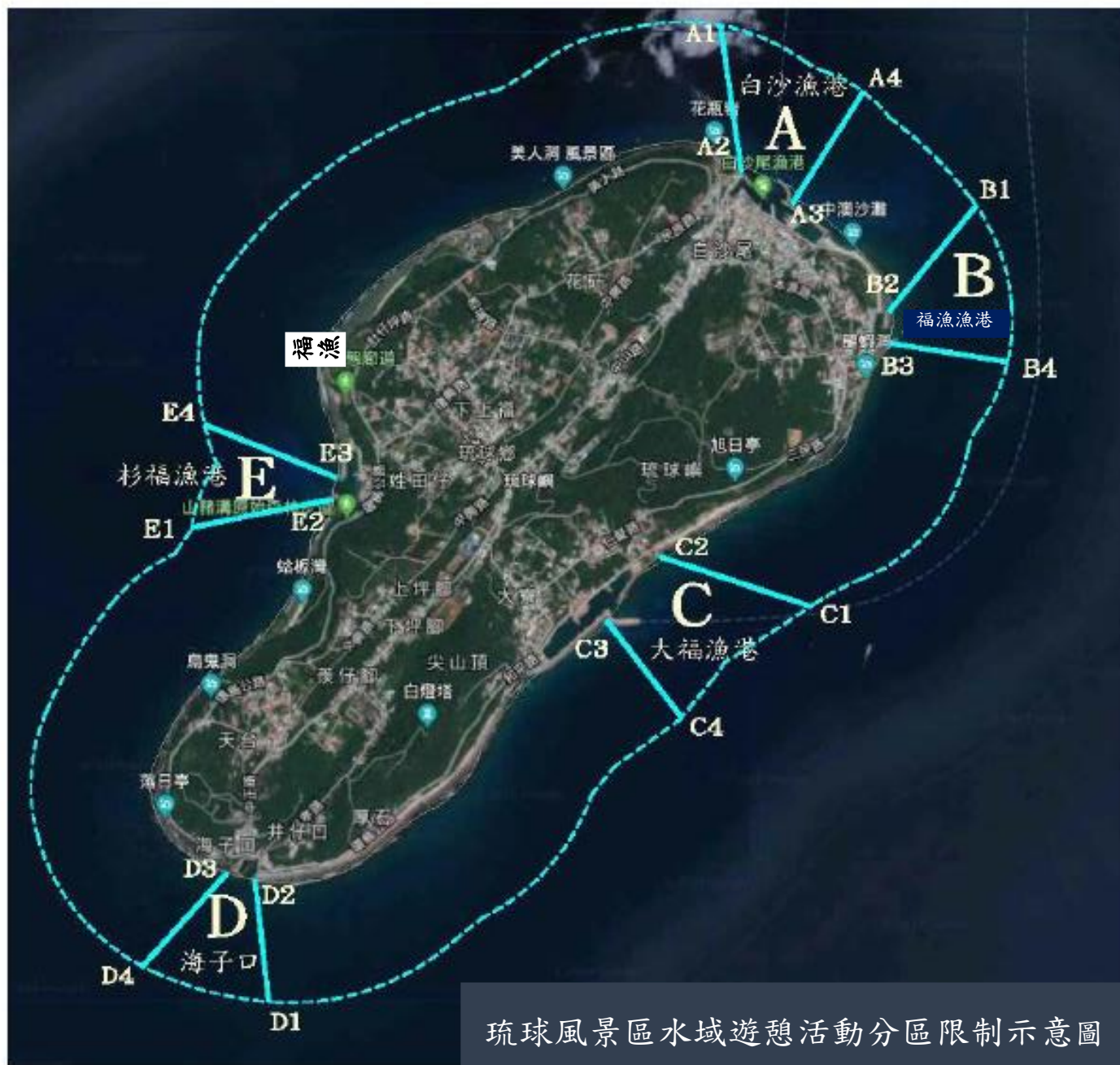
琉球風景區水域遊憩活動分區限制示意圖