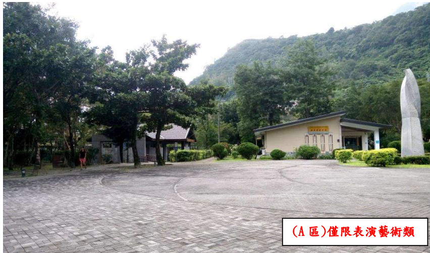
A 潭北廣場表演區(1 組)