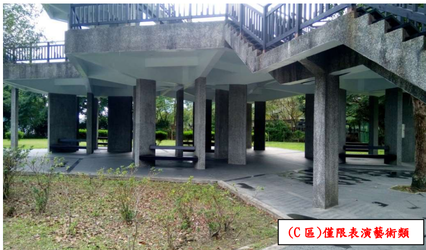
C 潭北高眺亭區(1 組)