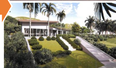
國際級遊客親水休憩空間、自行車服務及在地產品展售