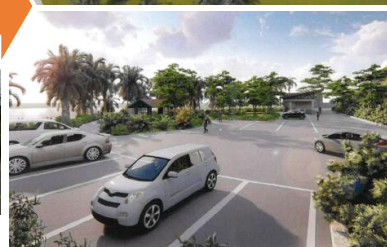
串聯加母子灣濱海步道，改善據點動線配置