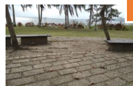
現有設施陳舊，服務功能不足