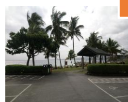
車行動線通道狹窄