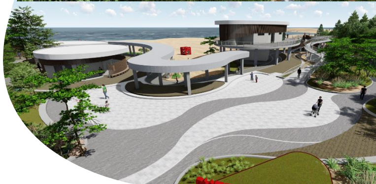
工程區位圖/示意圖