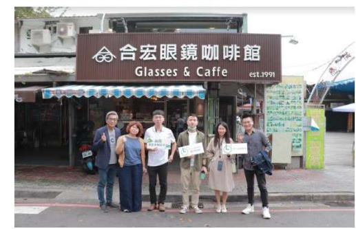
➡ 「合宏眼鏡咖啡館」團隊交流