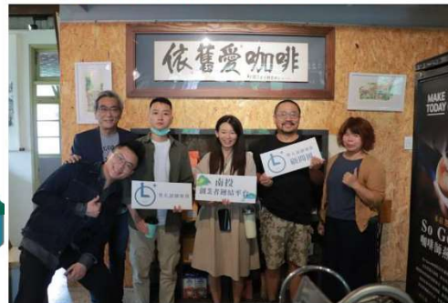
➡ 「依舊愛咖啡」店家交流