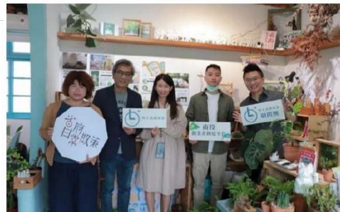
➡ 「華麗轉身」團隊基地交流