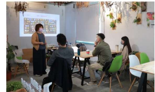
➡ 「華麗轉身」團隊交流過程