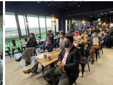
空間多功能使用示意