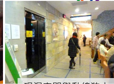
現況空間與動線狹小