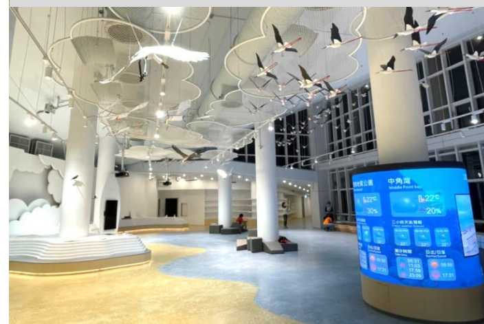
A棟建物外觀優化模擬圖