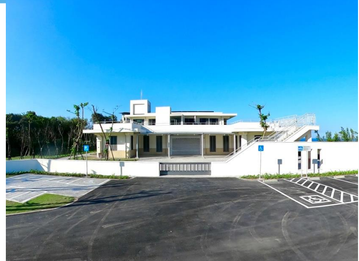
國聖埔營舍及周邊景觀改善