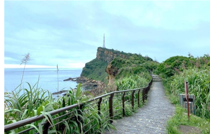
野柳地質公園第三區步道、欄杆整修更新