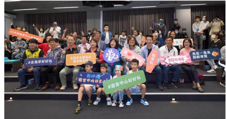
白沙灣遊客中心開幕