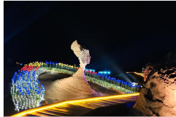
2022野柳石光-夜訪女王