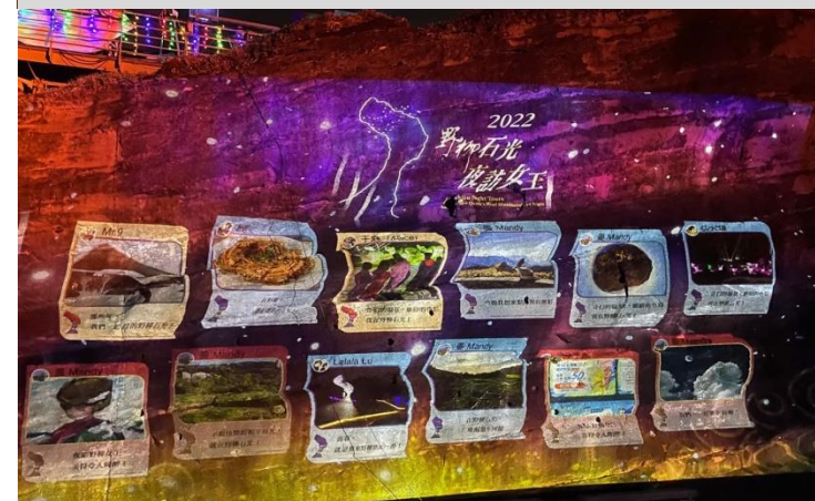
2022野柳石光-夜訪女王(岩壁光雕互動體驗)