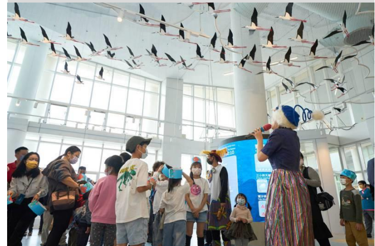
與杯子劇團合作「我是一隻魚」戲劇導覽