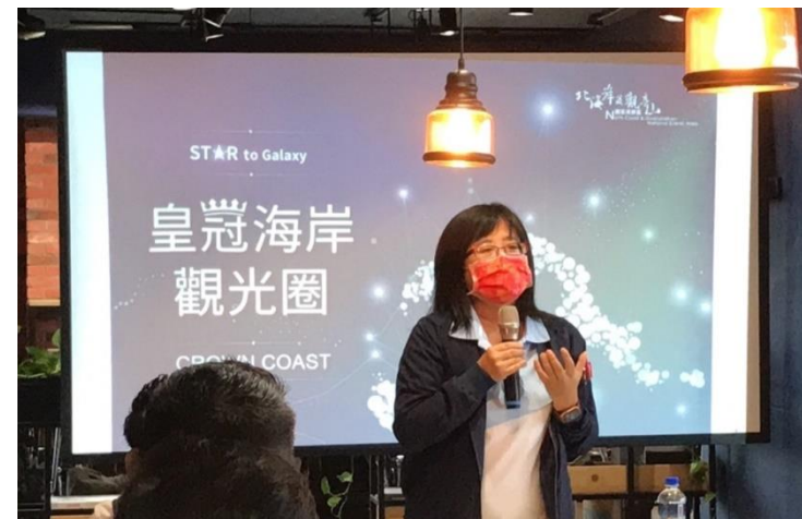
皇冠海岸觀光圈共識暨產業風格型塑店家說明會