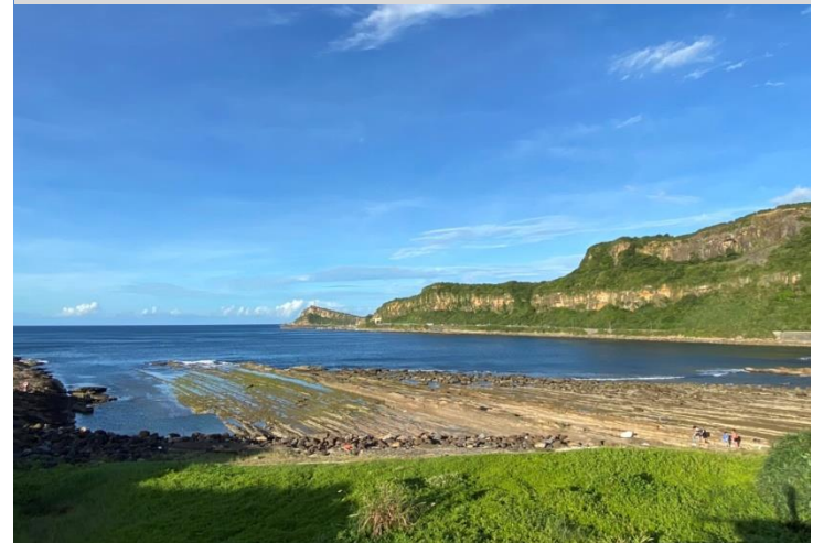
國聖埔營舍周邊景觀，眺望野柳岬