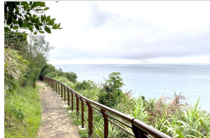
野柳地質公園第三區步道、欄杆整修更新