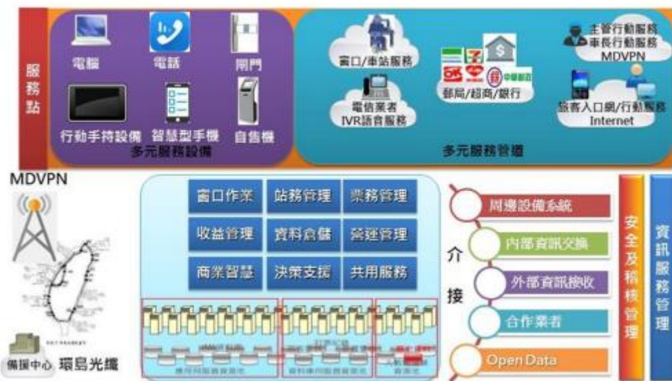
圖5 票務系統整合再造計畫示意圖

範疇包含台鐵票務核心系統建置（包括票務系統開發與維運、中介系統軟體、工具軟體、硬體設備、現有機房擴建）、票務網路建置、備援中心、票務周邊設備、機房網路語音、票務資安強化、台鐵創價服務。