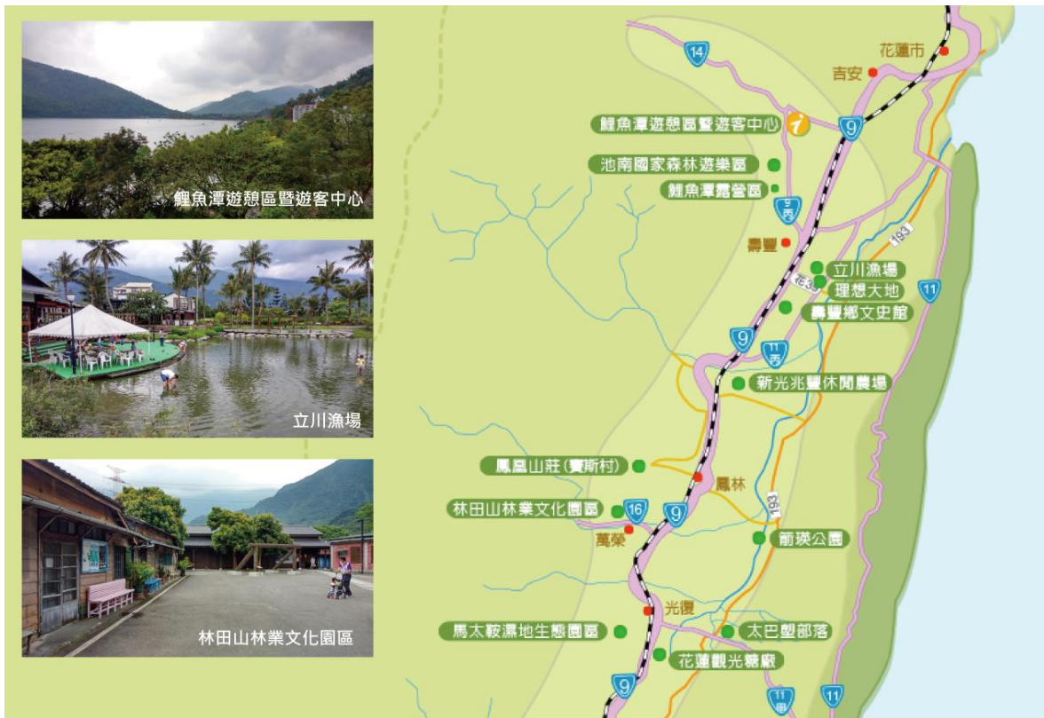
圖8 北區鯉魚潭系統重要觀光景點