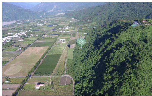
熱氣球自由飛空中遊覽