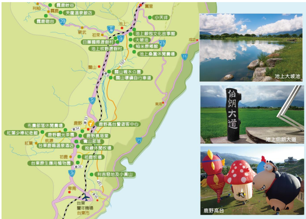
圖11 南區鹿野系統重要觀光景點