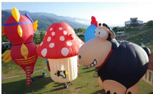
熱情森巴嘉年華造型熱氣球

除熱氣球飛行、音樂光雕等活動，主辦單位亦有婚紗攝影、17 夢想起飛—紙飛機比賽、樂活漫遊活水湖等系列活動。