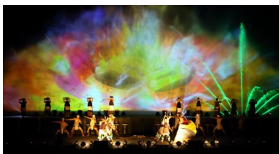
山水實境秀 3D 投影表演

由花蓮縣政府主辦，交通部觀光局花東縱谷國家風景區管理處、壽豐鄉公所協辦的鯉魚潭紅面鴨 fun 暑假活動，主要搭配水舞及夜間水幕電影、紅面鴨聲光秀及山水實境秀「奇萊傳說」。2016 年為期 44 天的暑假活動，吸引逾 80 萬人次遊賞，花蓮縣政府提供六期往返鯉魚潭貼心接駁服務吸引超過 9,200 人次搭乘。2017 年花蓮縣政府也持續推出移動的鴨鴨兄妹首度現身鯉魚潭迎賓，母鴨帶小鴨等，3D 光雕、原住民舞台表演(山水實境秀)、韻律噴泉秀、紅面鴨聲光秀等，多元創新活動，藉以吸引遊客參與。此外，配合國際直航政策，特別於活動期間安排搭乘曼谷花蓮首航的泰國遊客參與觀賞。