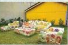
眷戀包圍式建築設計，重新定義了包圍式建築的精髓。

「我們一開始就希望建築出來的房子能重新定義門口」與傳統建築形式迥異的眷戀包圍式，重新詮釋了包圍式建築的精髓。這套眷戀包圍式建築，以「包圍式」為核心理念，重新定義了包圍式建築的精髓。這套眷戀包圍式建築，以「包圍式」為核心理念，重新定義了包圍式建築的精髓。