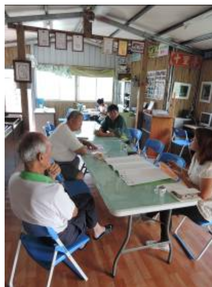
2014年07月22日，李子園第一次社區工作坊