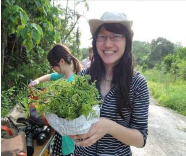
本團隊於 175 小旅行實際案例

本計畫以南寮極柑、李子園龍眼產業為小旅行推廣主軸，藉由小旅行帶領遊客以『體驗』瞭解在地產業特色，強化社區產業品牌與形象，建立遊客和農民的友誼關係，幫助在地農產銷售。