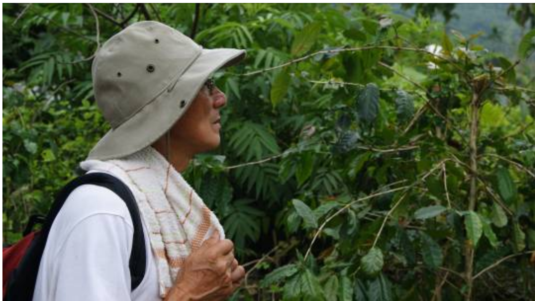
本團隊 175 小旅行實際案例

旅行不僅是追求身心靈的放鬆，而是透過旅行尋找在我們心中遺忘已久的感動，那份人與人重新相遇的溫暖。每個聚落都有屬於它的氣味，在我們的五感體驗中，總是忽略了嗅覺的感受，一種透過心來尋找屬於我與地方的氣味。『175 咖啡公路』一條擁有咖啡、椪柑、龍眼、野蜂等豐富產業的特色公路，旅途中，除了味覺與視覺感受外，放慢腳步，更可感受到不同季節的獨特香氣與景色。為有效整合西拉雅風景區區域資源，帶動地方產業與人文發展，本計畫針對關子嶺溫泉商圈、白河南寮社區與東山李子園社區產業，藉由 175 小旅行進行資源整合與串聯，透過漫步旅行的方式帶領遊客深入瞭解在地產業及文化，以『氣味』概念打造西拉雅 175 咖啡公路新特色。