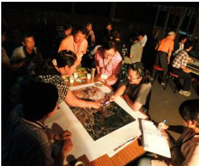
本團隊於雲林湖山地區小旅行實際案例

南寮與李子園社區人口組成以老年人居多，未來小旅行行銷與宣傳經營模式為一大考驗。為有效解決社區人力資源不足困境，本計畫將與關子嶺溫泉商圈業者共同合作，以資源共享、互相扶持合作之概念推展小旅行，有效達到區域資源整合及串聯之