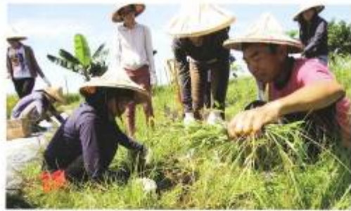
▲ 農作下田，與牛共舞，讓村民從傳統農耕中找回生活。

「我們希望看見鄉土真味，這是一項以農村發展為主題的計畫，希望透過文史、民俗、藝術、藝文大交流，讓村民從傳統農耕中找回生活。」