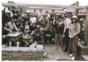
▲ 2011年聯合「土溝農村文化發展協會」以「土溝」為題，舉辦一場文史、民俗、藝術、藝文大交流「土溝年會」。