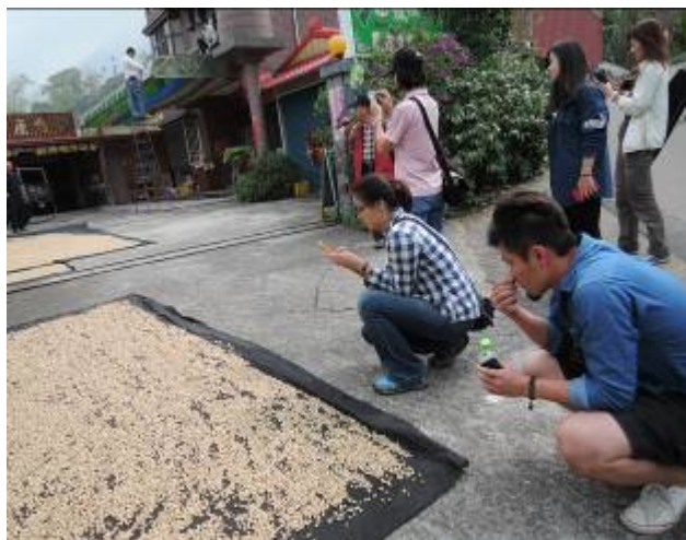
本團隊 175 小旅行實際案例

175 咖啡公路原有咖啡特色主題為基礎，以『香氣』體驗概念結合社區龍眼、椪柑、咖啡產業，藉由不同農事時程規劃主題遊程，讓來訪者透過五感體驗 175 公路龍眼花香、窯香、咖啡香、椪柑酸甜香及人情香氣。