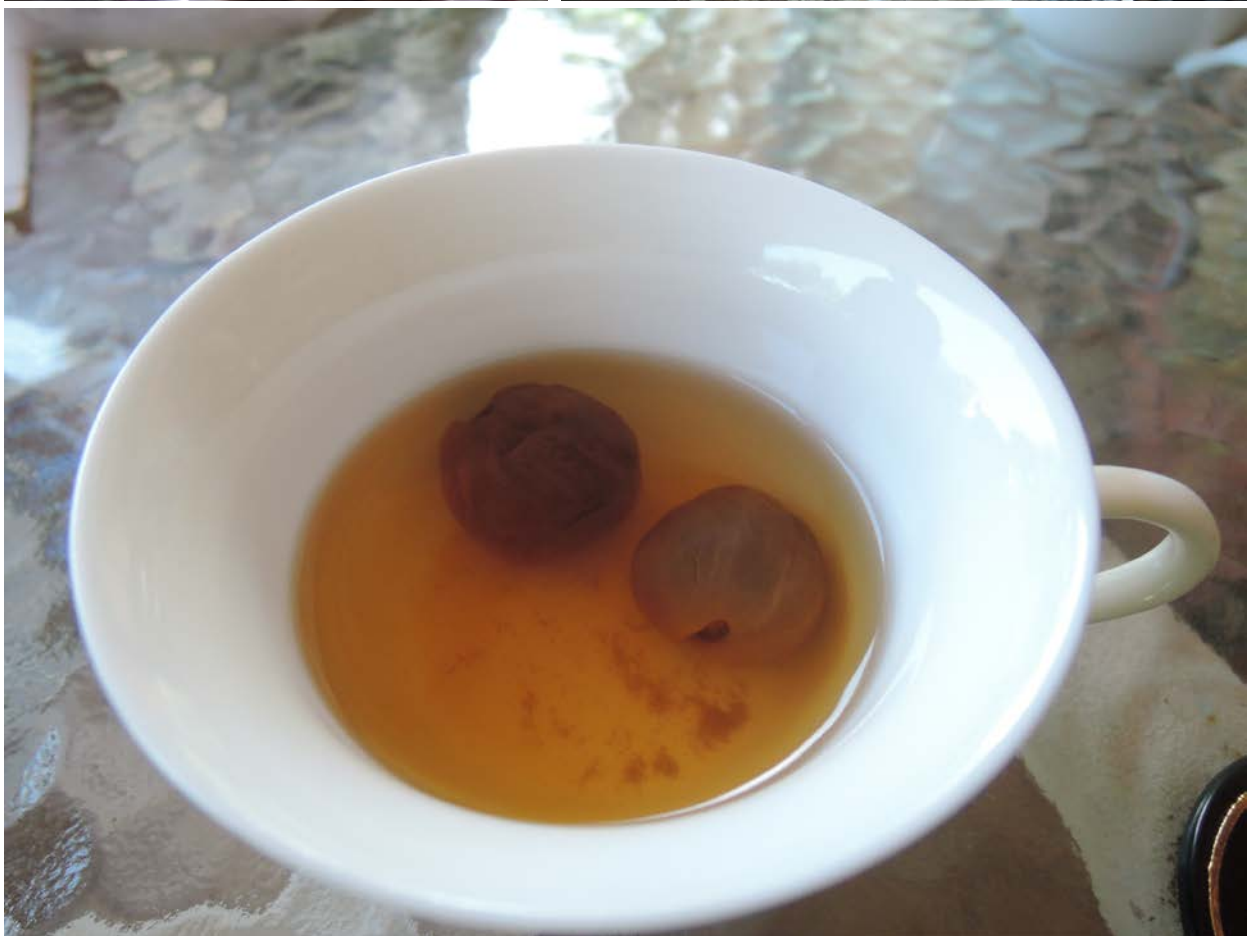
2014年07月29日，李子園第二次社區工作坊