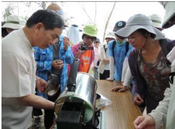
本團隊於 175 小旅行實際案例

針對社區與關子嶺溫泉業者舉辦 175 小旅行說明會，從中瞭解未來可 合作之機制，建立雙方合作之關係。