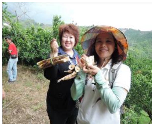
本團隊於 175 小旅行實際案例

本計畫於一期計畫執行間，搭配社區產業生產期，已規劃李子園咖啡體驗、南寮椪柑園農事體驗行程。為有效推廣社區產業特色，將搭配李子園 7-8 月龍眼產季、南寮 10-11 月椪柑採收季，設計 175 小旅行新體驗行程，增加社區季節體驗豐富度。