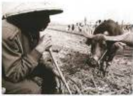
▲ 農作下田，與牛共舞，讓村民從傳統農耕中找回生活。