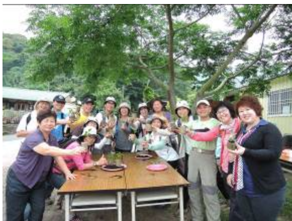
本團隊於 175 小旅行實際案例

針對李子園社區、南寮社區新體驗 行程，舉辦 2 場次小旅行體驗，以社 區及關子嶺溫泉業者為此次行程踩線 團對象，藉由實際行動中修正不足之 處，建立未來可合作之模式。