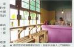
安徒生夢地，重新定義了包圍式建築的精髓。