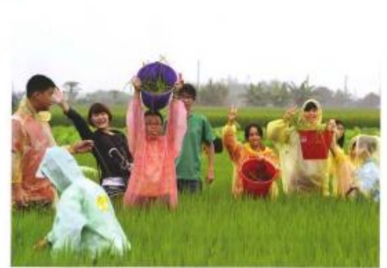
▲ 鄉土真味，看見鄉土真味，讓村民從傳統農耕中找回生活。

「我們希望看見鄉土真味，這是一項以農村發展為主題的計畫，希望透過文史、民俗、藝術、藝文大交流，讓村民從傳統農耕中找回生活。」