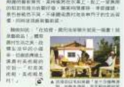
包宅一包何種活到老，學到老。這套包宅一包何種活到老，學到老。