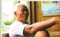
包宅一包何種活到老，學到老。這套包宅一包何種活到老，學到老。