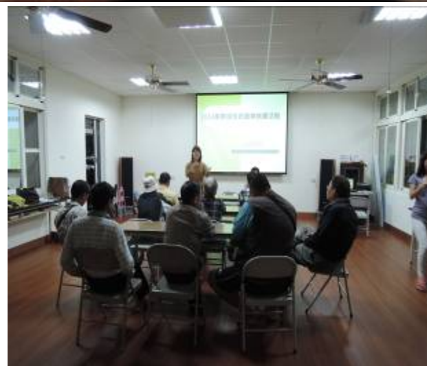
2014年11月25日，南寮社區第四次社區工作坊