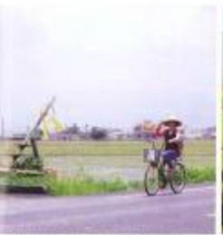
▲ 鄉土真味，看見鄉土真味，讓村民從傳統農耕中找回生活。

「我們希望看見鄉土真味，這是一項以農村發展為主題的計畫，希望透過文史、民俗、藝術、藝文大交流，讓村民從傳統農耕中找回生活。」