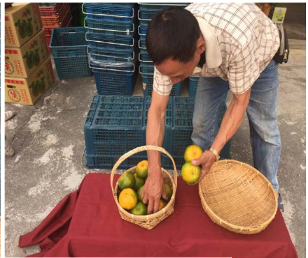
2014年11月04日，南寮社區第三次工作坊