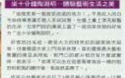
包宅一包何種活到老，學到老。這套包宅一包何種活到老，學到老。