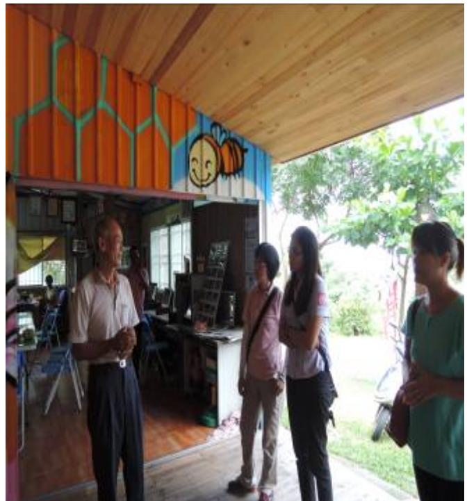
2014年09月16日，李子園第四次工作坊