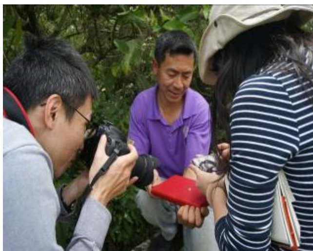
本團隊 175 小旅行實際案例

藉由 175 小旅行工作坊舉辦，引導社區自我資源整合及學習產業品牌行銷模式。小旅行舉辦過程中，實際瞭解未來社區自主營運模式為何，並透過實際操作過程中強化自我認同感與經驗，依各社區產業與人力現況，協助建立未來營運機制。