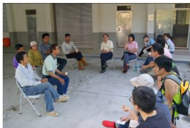
本團隊於 175 小旅行實際案例

各社區舉辦 4 場次居民討論工作坊，規劃新體驗行程，其工作坊內容包括新體驗行程規劃、小旅行試辦、內容修正與調整、後續發展規劃，並從中建立未來社區自主營運之機制。