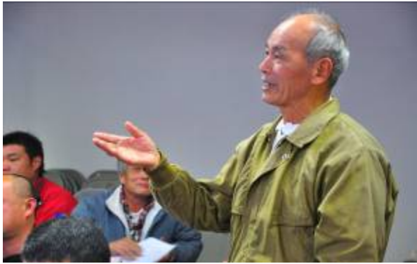
本團隊於 175 小旅行實際案例