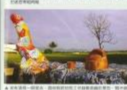
包宅一包何種活到老，學到老。這套包宅一包何種活到老，學到老。