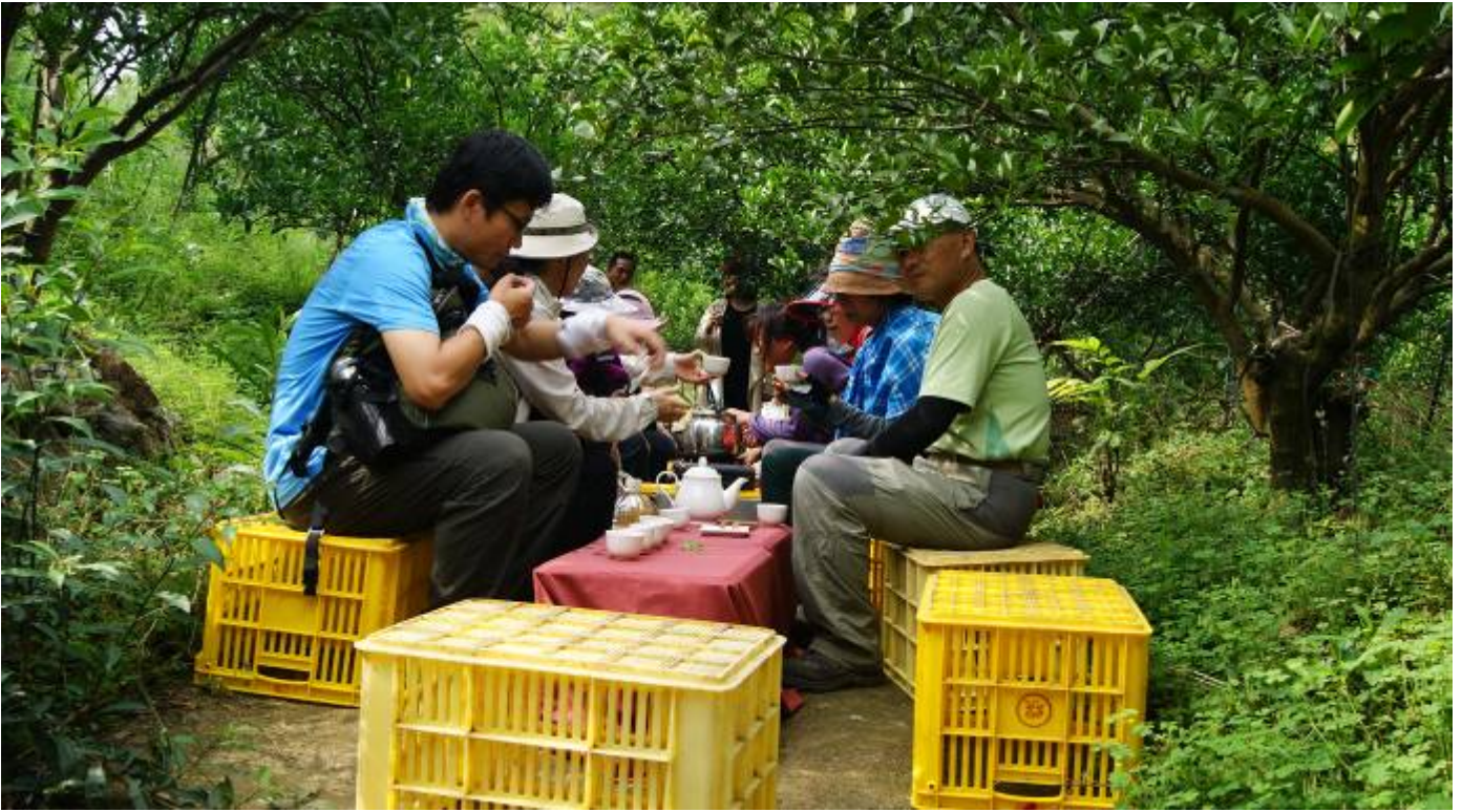
本團隊 175 小旅行實際案例

促成社區與關子嶺溫泉區業者合作，小旅行行程規劃，以關子嶺地區延伸至南寮、李子園社區，藉由小旅行舉辦增加關子嶺地區旅遊豐富度及內涵，以深度旅行方式，延長遊客停留時間，進而帶動當地觀光發展。