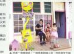
安徒生夢地，重新定義了包圍式建築的精髓。