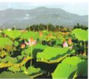
▲ 鄉土真味，看見鄉土真味，讓村民從傳統農耕中找回生活。