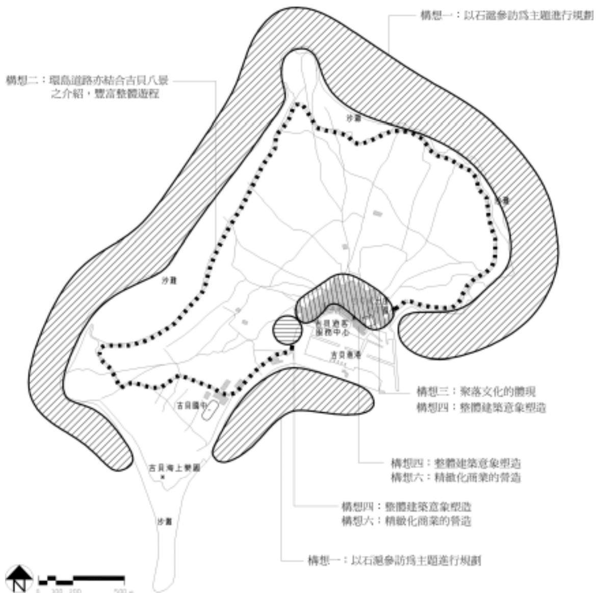
圖 -4-2 吉貝嶼發展構想區位圖

輔導各分區成立自主性經營管理體系，主管機關則為輔導及提供協助、仲裁的角色。藉由地區性自主經營管理體系的建立，由地方人士擔任地方與主管單位間的協調角色，以利於相關工作之執行。