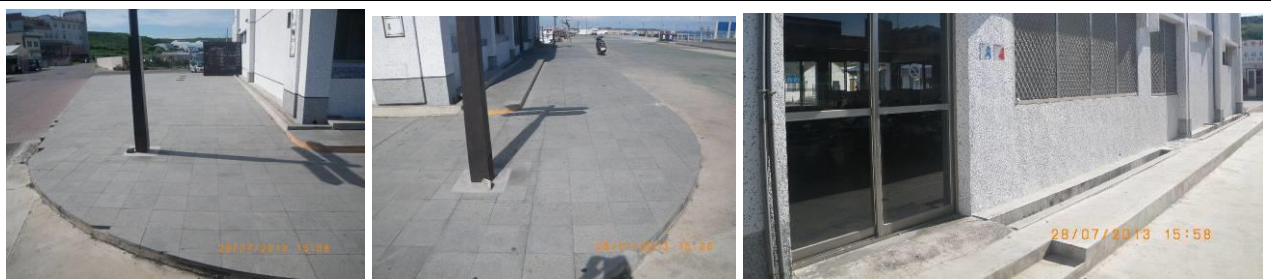
清潔範圍現況圖照-建物週圍