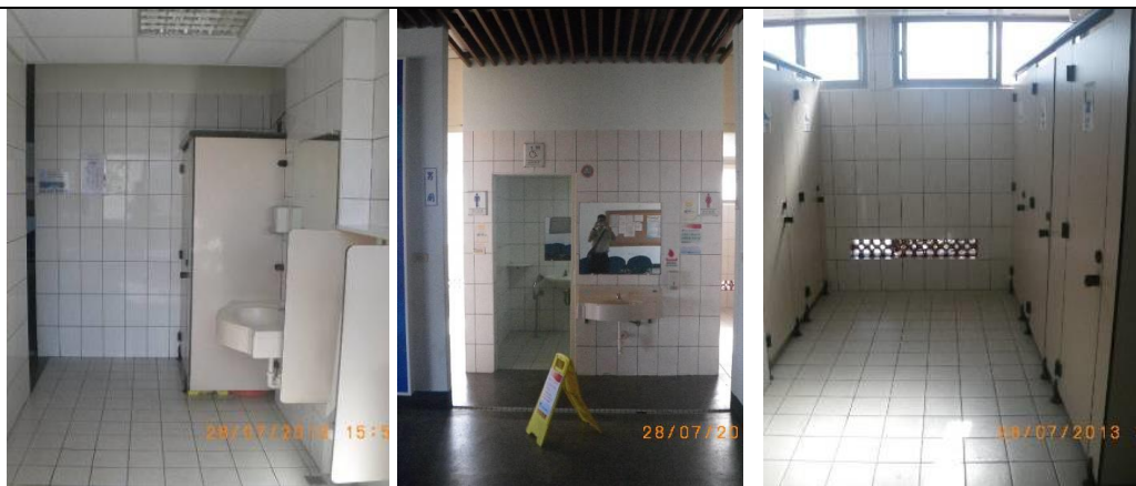
清潔範圍現況圖照-公廁