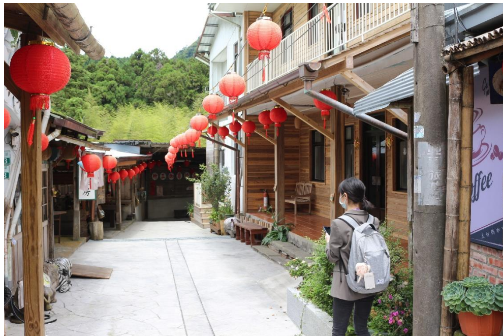
奮起湖老老街環境改善