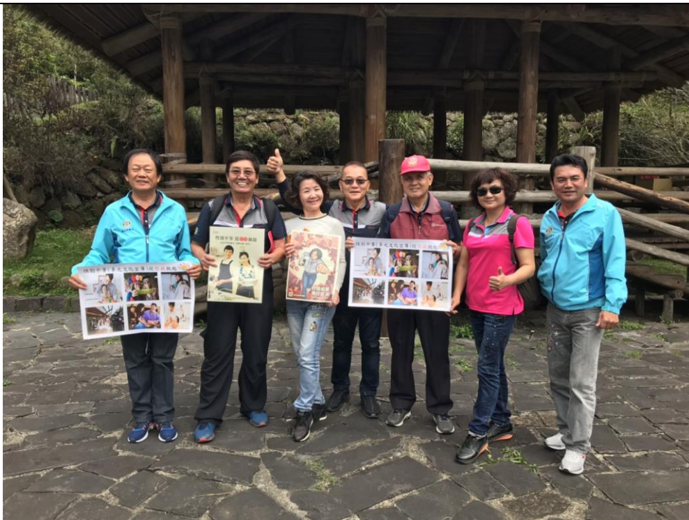
成 果 照 片