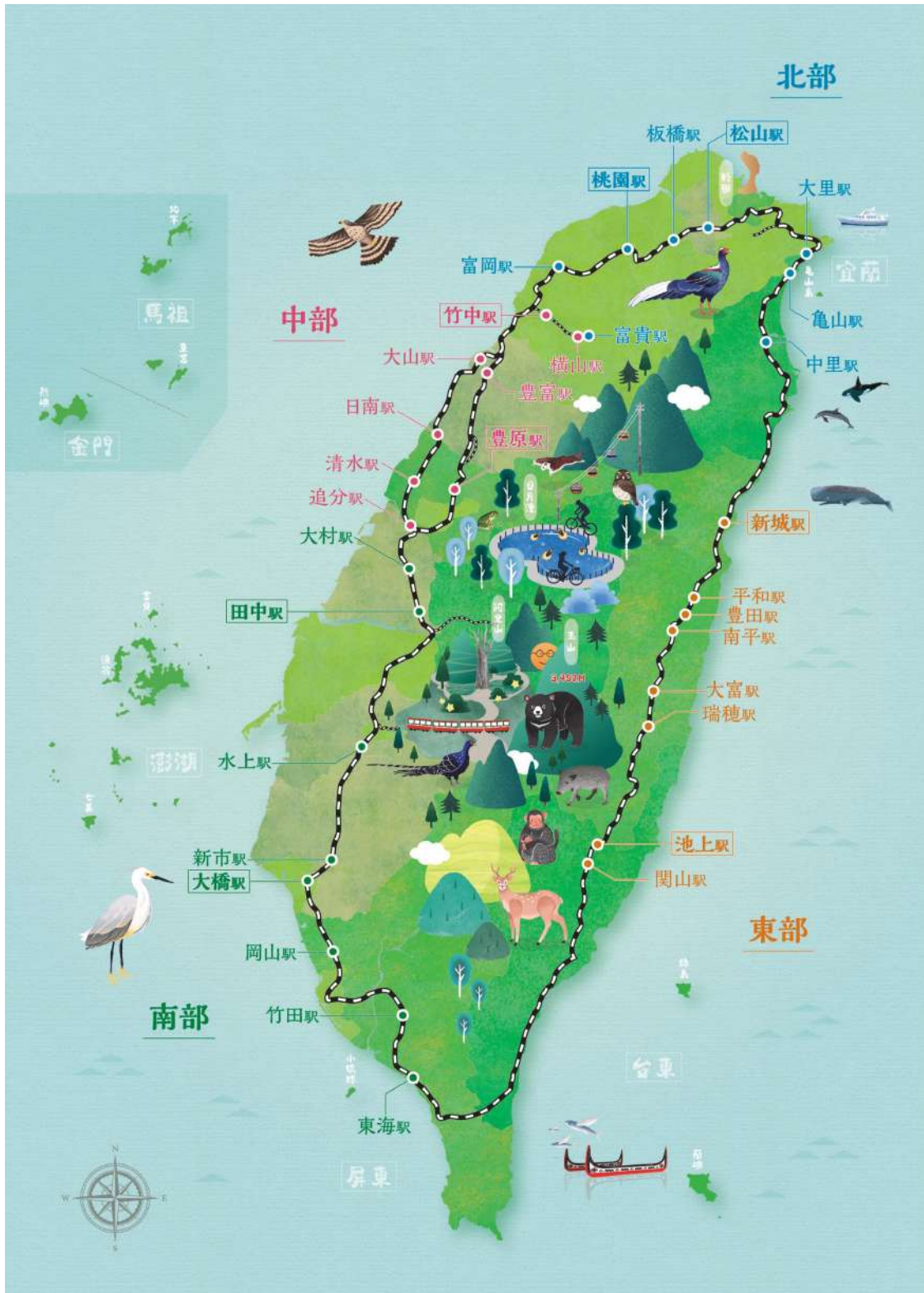
附圖1 台日32同名車站鐵道旅行地圖及分組區位圖