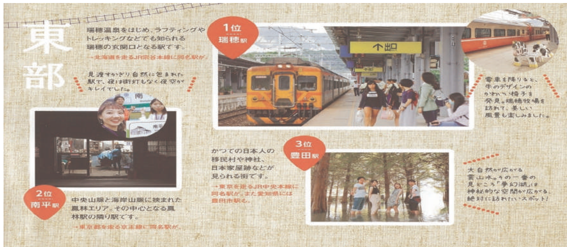
圖7 東區組同名車站票選前三名(瑞穂、南平、豊田)勝出圖