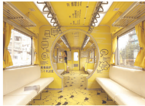
照片9 彩繪列車車廂內裝設計