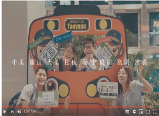
照片6 北區組在北部8站活動剪影