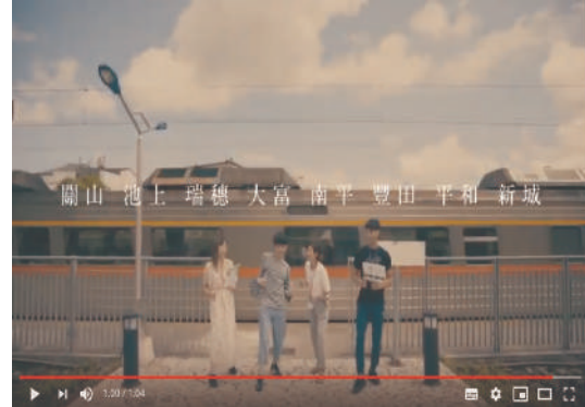
照片7 東部8站體驗活動剪影