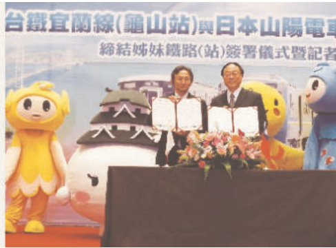
照片3 台日同名龜山站締結姊妹