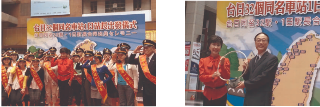
照片4.5 台北車站舉辦台日32個同名車站「出發儀式」