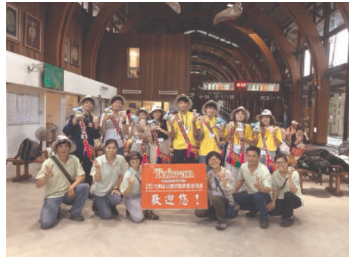
照片11 東區組2019年池上站合影