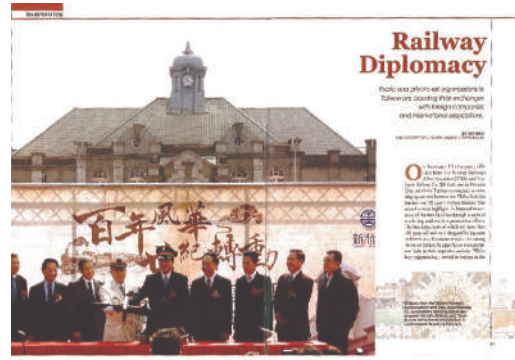
圖1 新竹站及東京站締結姊妹報導