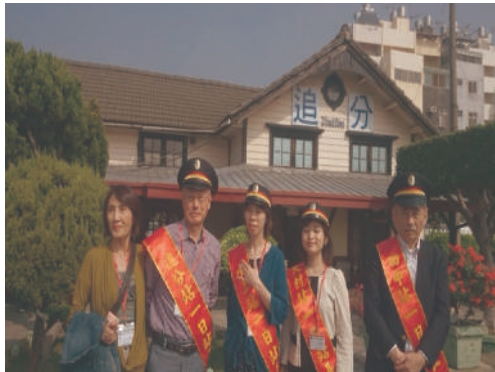
照片10 追分站2014年留影

成員的主動參與均成為重要關鍵。2014年「一日站長」採32車站32名之分組原則，共7分組同小組者彼此相互觀摩（如照片10同組到訪車站合影）每一區觀光局至少配置一位輔導員，而2018及2019年由日大學生及男女混合分別組成四組與五組方式，透過討論更能激發不同的思維想法與建立學習合作機制，所以活動主角的凝聚力強（如照片11東區組同學快樂合影）。因此，「青春·若旅」較「一日站長」方案之各組成員的年齡及教育水準相當致能激發團隊意識感，2018年參加活動之台日學生共16名及在地好友加油人員16名共32名，參與「體驗比賽組」的日籍學生返日後，特別於同年9月23日JATA東京旅展亦參與台灣館活動分享發表在台灣鐵道旅遊之心得成果，也顯示對活動組織之向心力。