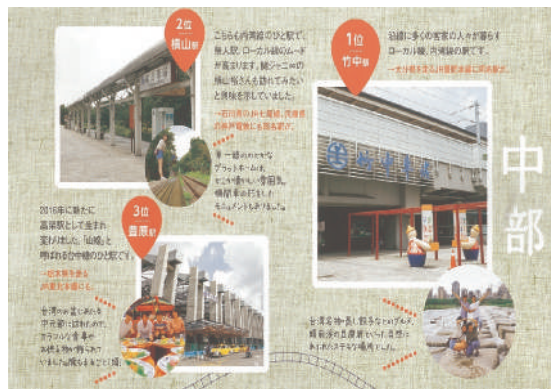
圖5 中區組同名車站票選前三名圖