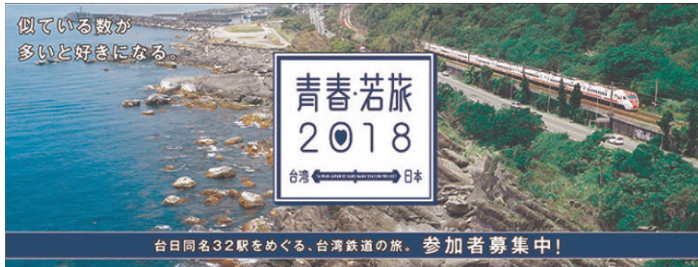
圖3 台日同名車站日本招募廣告圖

及互助完成任務的成就感。本專案是2018年起延續交通部觀光局主辦及臺灣鐵路管理局協辦，由觀光局駐大阪辦事處統籌規劃32同名車站活動暨台灣鐵道觀光推廣活動。