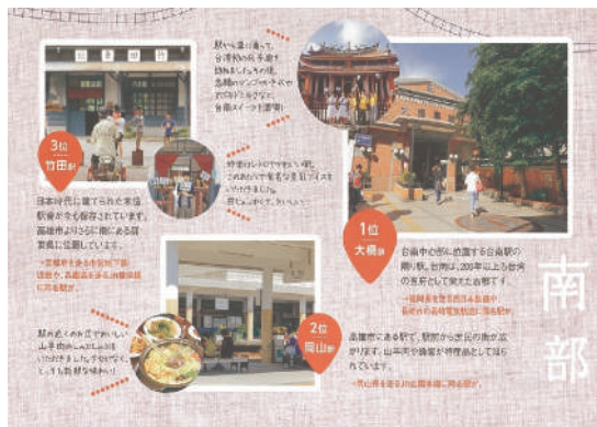
圖6 南區組票選前三名車站圖