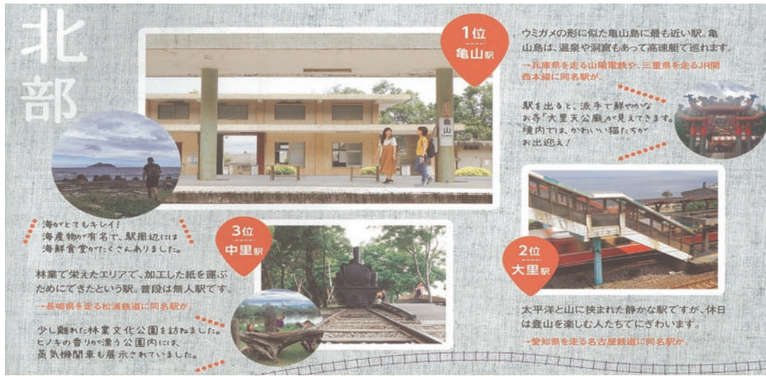
圖4 北區組同名車站票選前三名(龜山、大里、中里)勝出圖