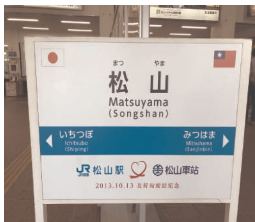
照片1 日本松山站內姊妹站看板

松山車站在1920年以前松山站是稱為錫口站，之後更名為松山站，也是自行車環島1號線的0公里所在地。松山車站周邊商業活動頻繁，松山地區的歷史、古蹟、文化特色與都市開發結合，此一地下化車站於2008年9月通車啟用，車站中央設置半戶外空間及陽光觀景平台設計，可遠眺鐵路騰空綠廊，並利用戶外開放式階梯漸層退縮的層次感，以塑造觀光遊憩車站及東區門戶意象。為擴大合作台鐵局與JR四國公司於2016年2月25日締結（如照片2），並於同年6月在台鐵松山車站特別設置日本JR四國交流願景館，以彰顯姊妹車站及共同合作之友好友誼。