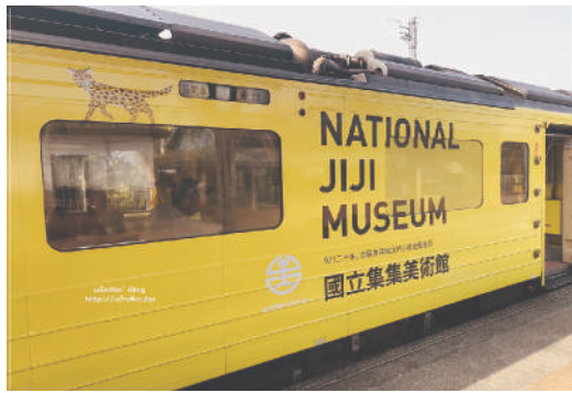
照片8 集集美術館鐵道列車車體