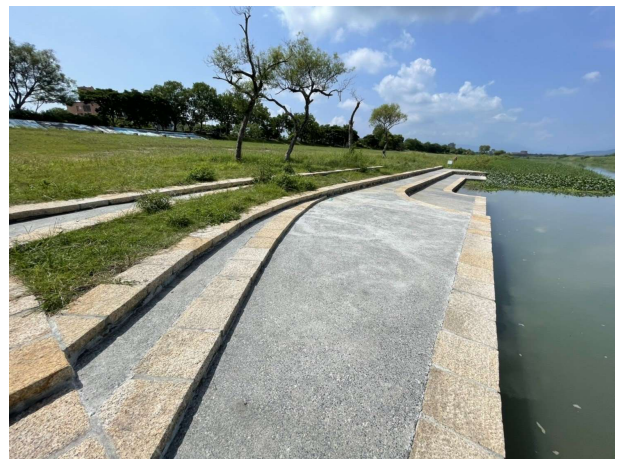
慶和橋多功能護岸