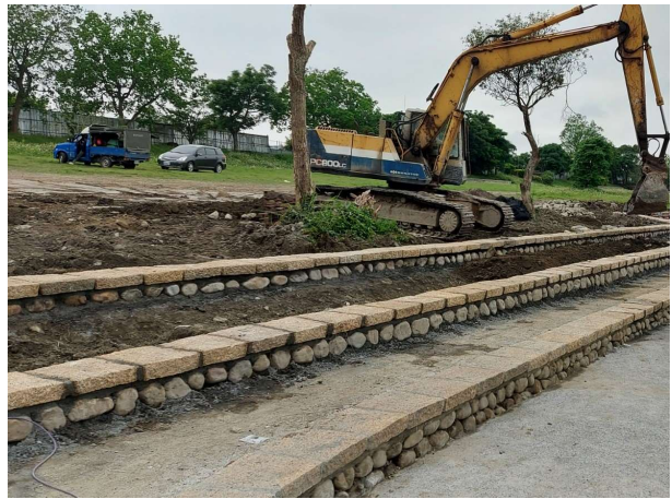
慶和橋多功能護岸施工