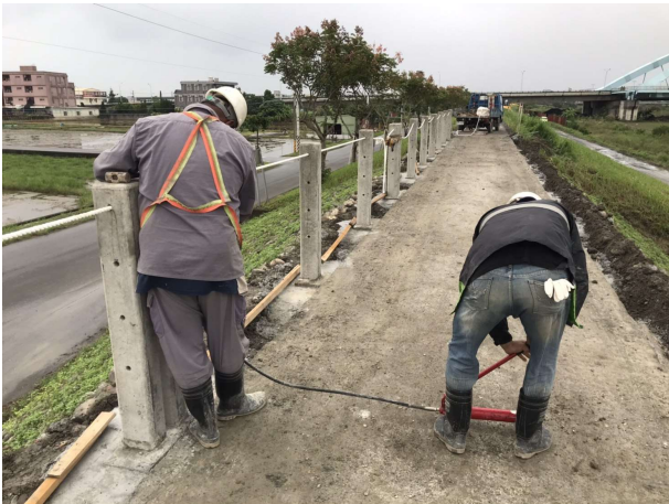
堤頂步道護欄施工