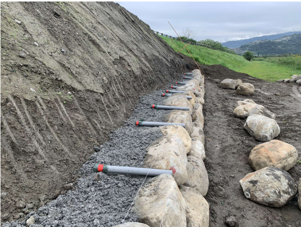
永金一號橋砌石施工