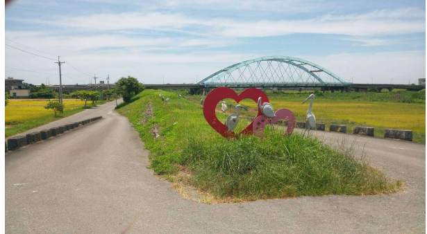
宜興橋至黎霧橋堤頂