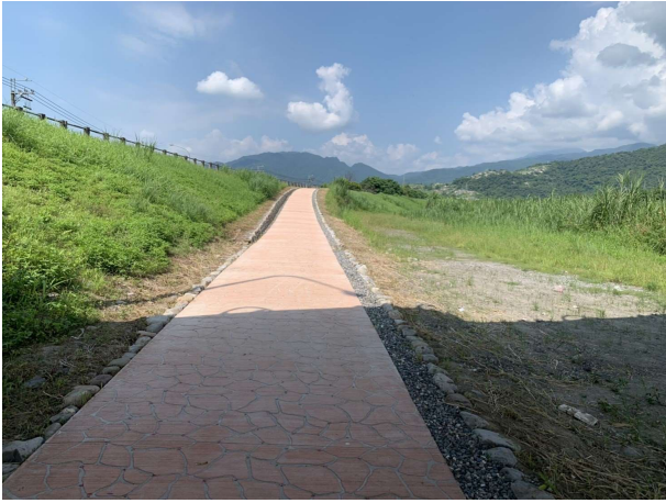
永金一號橋立體交叉