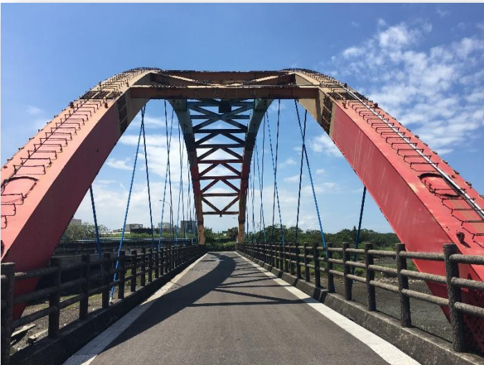
圖 3 彩虹二橋正面