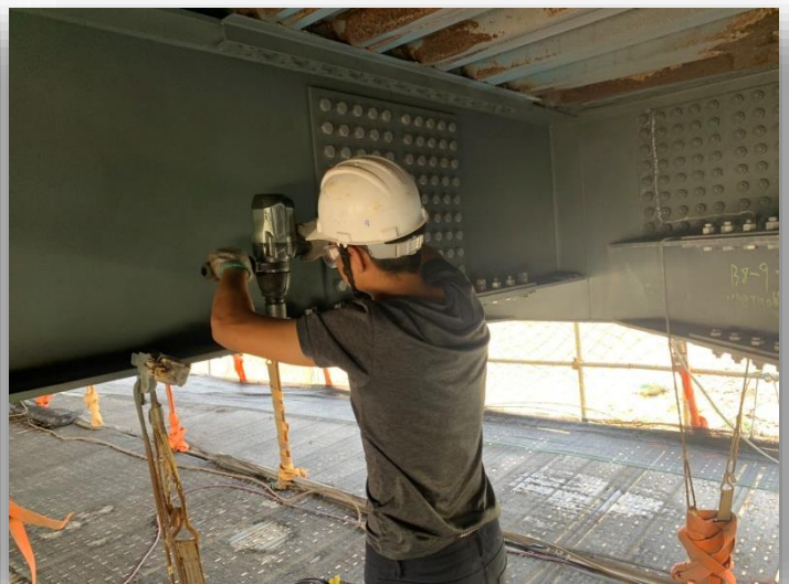
圖 4 螺栓更換