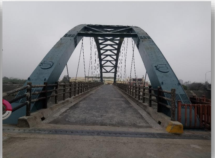
圖 2 彩虹二橋完工照片