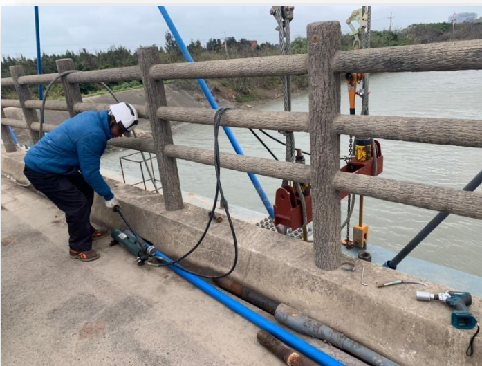
圖 3 吊索更換