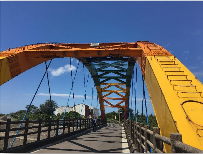
圖 1 彩虹一橋正面