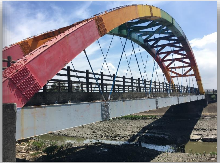
圖 2 彩虹一橋側面