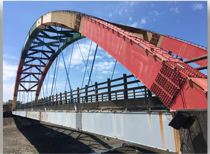
圖 4 彩虹二橋側面