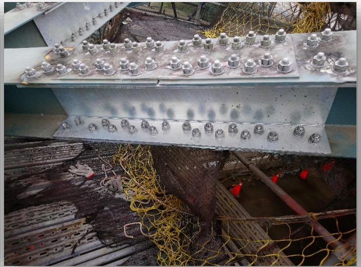
圖 2 以槽鋼補強肋梁銹穿處