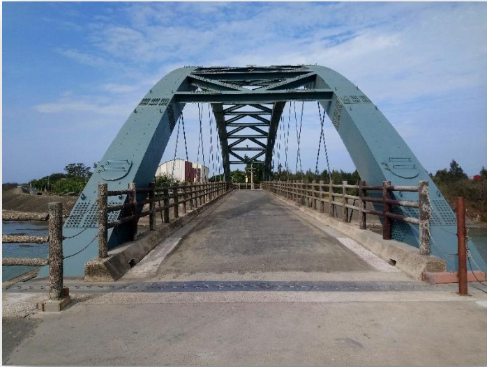
圖 1 彩虹一橋完工照片