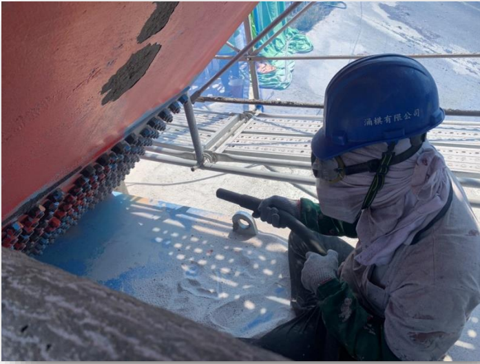
圖 1 噴砂除鏽